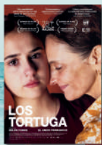
LOS TORTUGA MAR/28/JUL