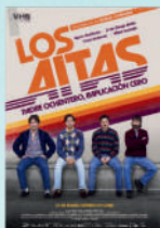
LOS AITAS LUN/13/JUL