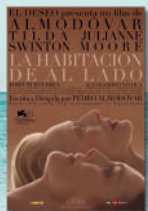
LA HABITACIÓN DE AL LADO JU/30/JUL