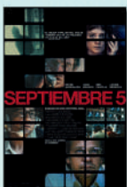
SEPTIEMBRE 5 MIE/22/JUL