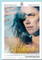
LOS DESTELLOS MAR/07/JUL