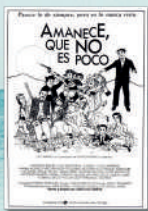
AMANECE QUE NO ES POCO LU/27/JUL