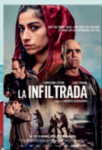
LA INFILTRADA MIE/29/JUL