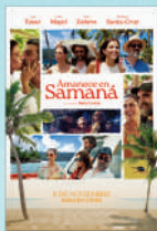
AMANECE EN SAMANÁ LUN/06/JUL