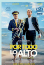
POR TODO LO ALTO MIE/15/JUL