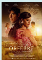
EL SECRETO DEL ORFEBRE MAR/21/JUL