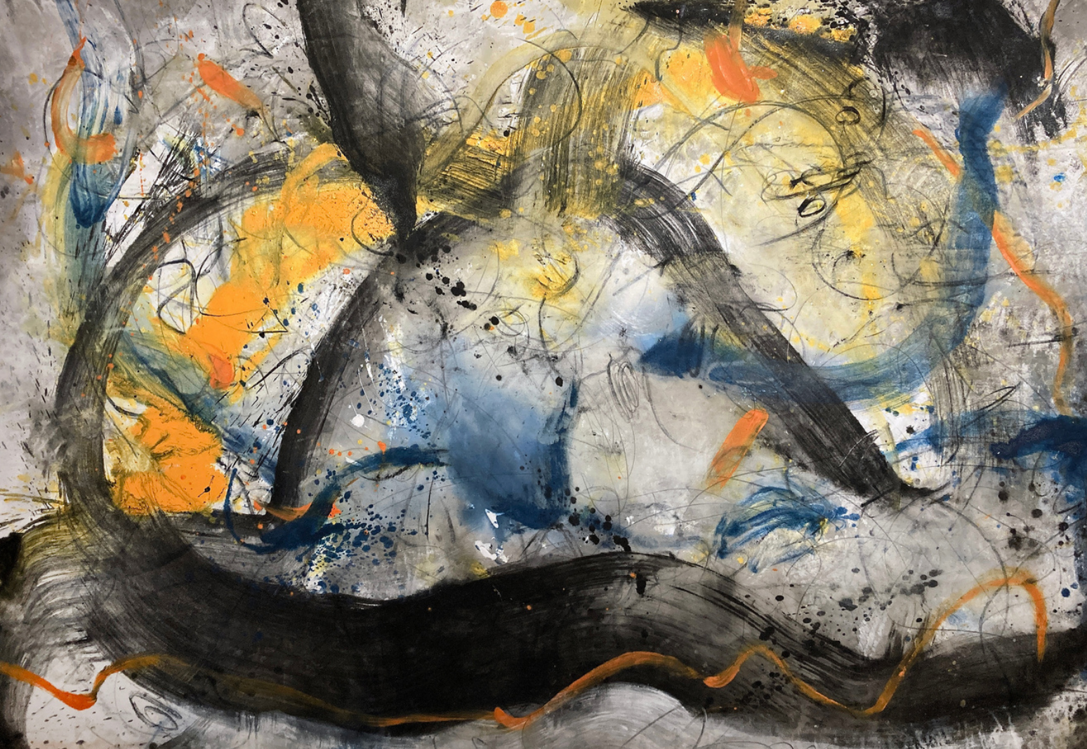
The Abstract Truth. Sidewalks of NY, 2021 Mixta s/tela, 276 x 198 cm

Del 2000 al 2003, la serie Intimidad , supone un retorno a lo gestual, esta vez sobre imágenes digitales impresas en tela de gran formato. Fotografías privadas tomadas en la convivencia conyugal transforman la superficie del lienzo blanco en una piel cargada de significado, sobre la que navega libre la materia pictórica.