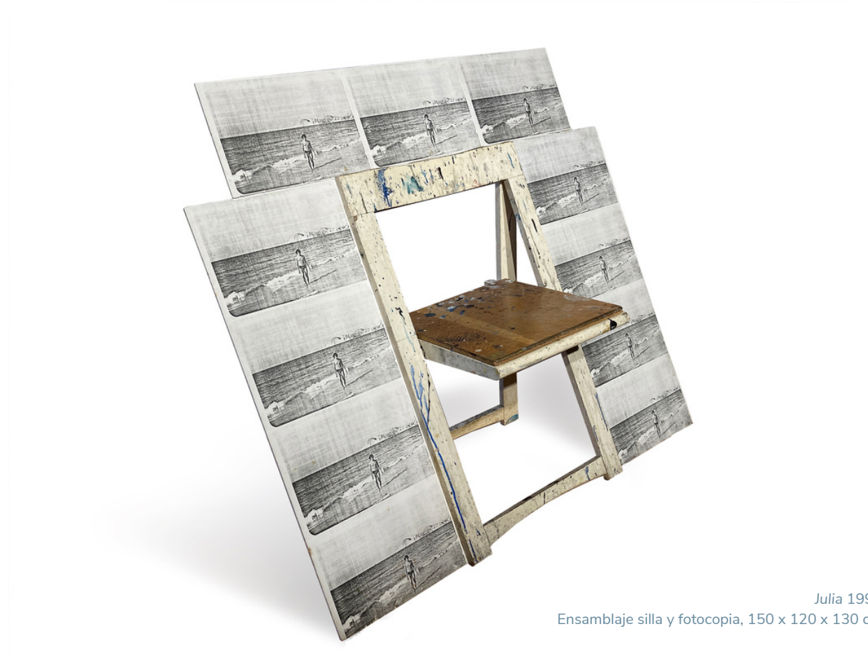
Julia 1991 Ensamblaje silla y fotocopia, 150 x 120 x 130 cm

Esta exposición, de carácter retrospectivo, recoge una amplia selección de la obra del artista Arturo Martín Burgos (Madrid, 1961), realizada a lo largo de las últimas cuatro décadas.