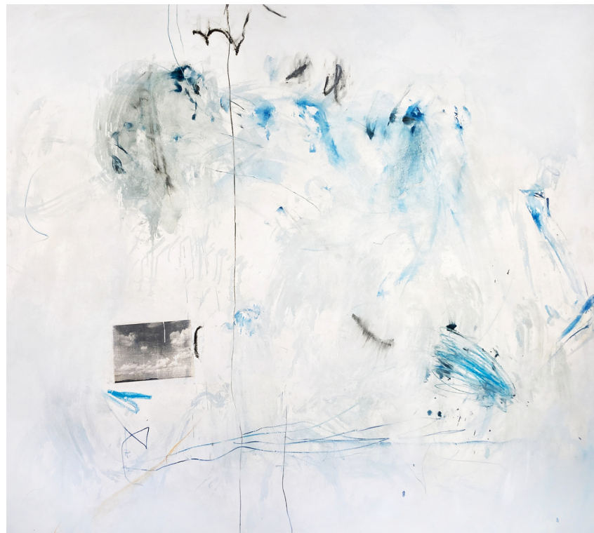
Blanco ligero, azul oscuro trazos de carbón, 1987 Mixta y collage s/tela, 200 x 268 cm