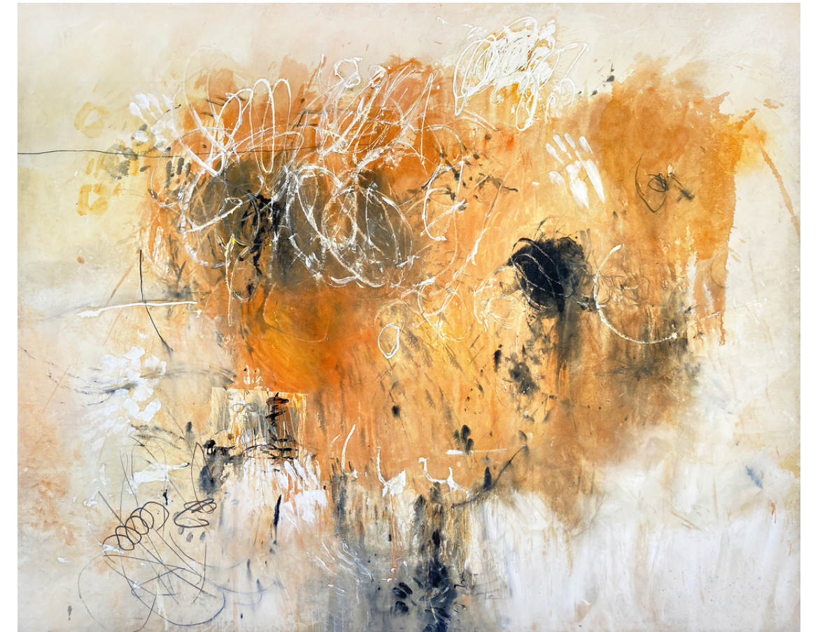
Papá, 1988 Mixta y collage s/tela, 200 x 295 cm

En los 90, las imágenes aumentan de tamaño en series como Kirk Douglas y Pasión, en las que desaparece la fotografía, prevaleciendo la abstracción gestual. En esta década también tiene lugar la incursión en las tres dimensiones con las series Objetos, Instalaciones y Ventanas, donde los utensilios del taller del pintor se transforman en obras de marcado carácter auto referencial, cercanas a una suerte de autorretratos.