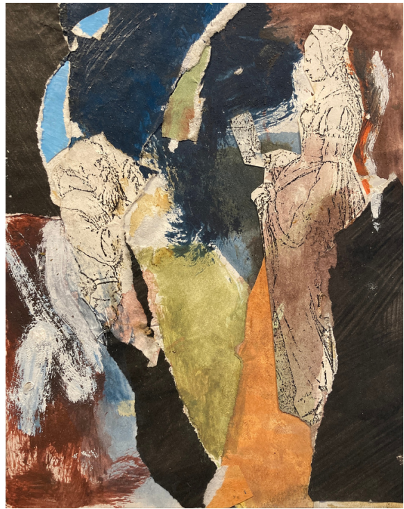
Las tentaciones de San Antonio III, 1985 Mixta y collage s/papel, 23,5 x 27 cm