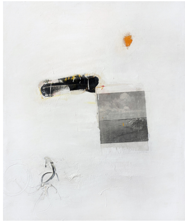
Paisaje (Blanco), 1986 Acrílico y collage s/tela, 100 x 81 cm