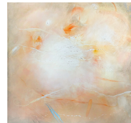
Luz del paraíso, 2012 Mixta s/tela, 200 x 200 cm