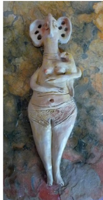
Diosa-pájaro Porcelana, 25 x 14 x 5 cm