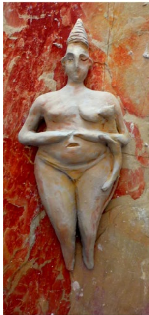
Matriarca turca Porcelana, 20 x 15 x 5 cm