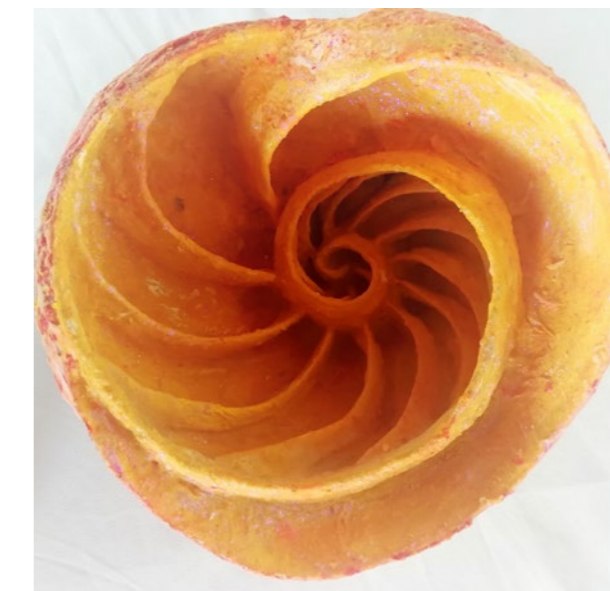
Madre Naturaleza en amarillo Técnica mixta, 21 x 22 x 18 cm