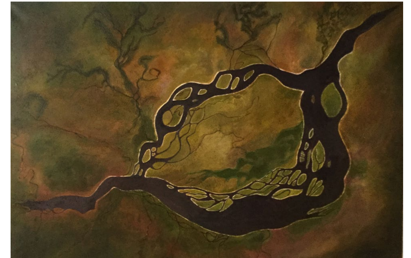
Ojos del Rio Congo . Acrílico sobre lienzo, 120 x 81 cm