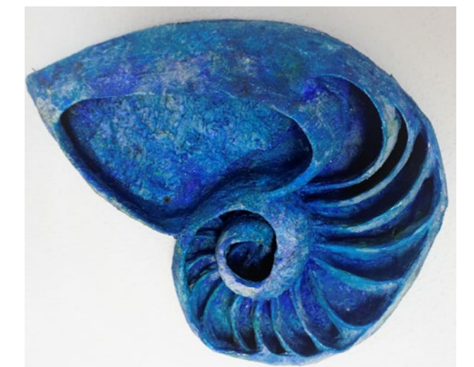
Madre Naturaleza en azul Técnica mixta, 50 x 40 x 20 cm