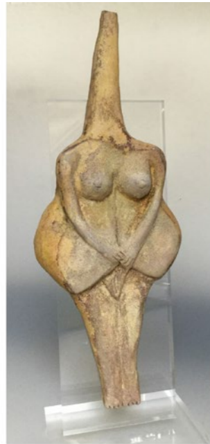
Matriarca búlgara Porcelana, 30 x 16 x 6 cm