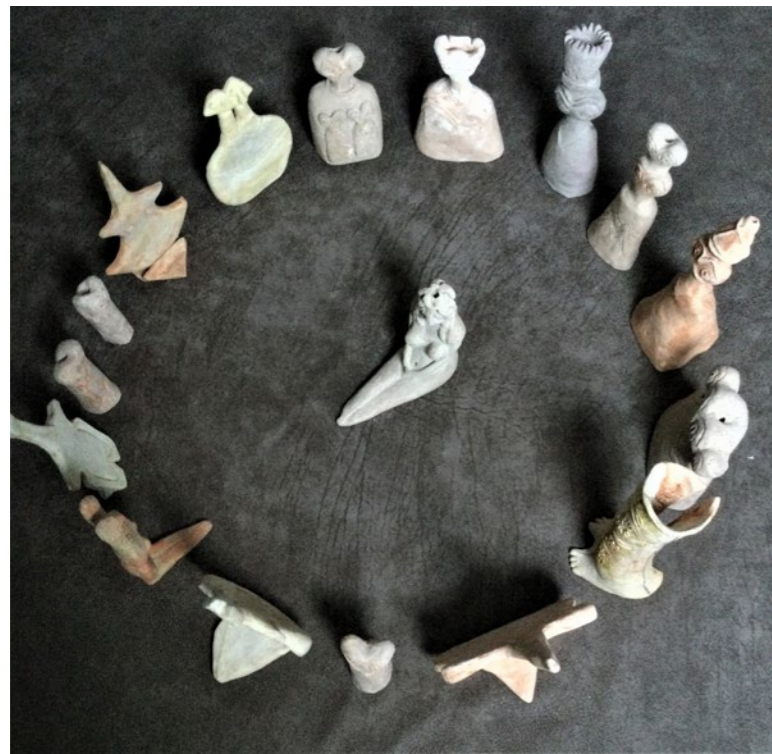
Instalación, El juicio . Terracota y porcelana, 70 x 70 x 30 cm